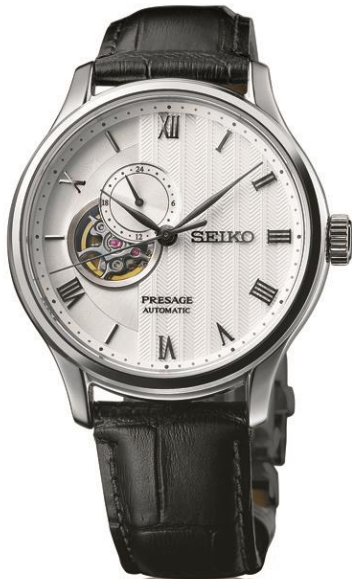
SSA379J1 UVP: 519 Euro

Die Uhren sind, wie ein idealer Zen-Garten, dezent, geordnet und ansprechend gestaltet und bieten beide eine 41-stündige Gangreserve.