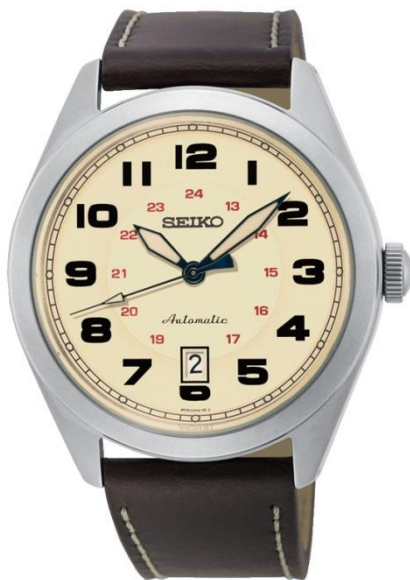
SRPC87K1 UVP: 279 Euro

Optisch orientieren sich die Uhren am Retro-Stil und weisen große, mit LumiBrite beschichtete Zeiger und Lederbänder mit Steppnaht auf.