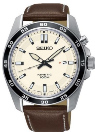
SKA787P1 UVP: 259 Euro

Die fünf neuen Modelle erzeugen ihre Elektroenergie selbst. Sie sind mit einem Mikrogenerator ausgestattet, der die Bewegungen des Trägers in elektrische Energie umwandelt. Wer kann sonst schon von sich sagen, dass er ein kleines Kraftwerk am Handgelenk trägt?