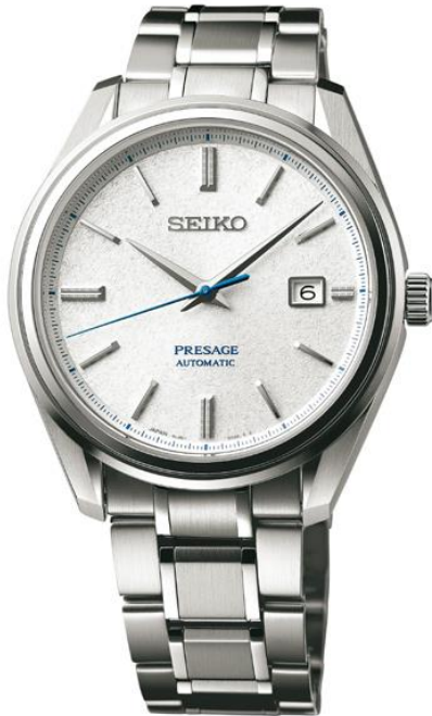
SJE073J1 UVP: 2.200 Euro

Das Gehäuse wird mit der Seiko eigenen Zaratsu Technik poliert und eine extrem widerstandsfähige Hartbeschichtung schützt das Gehäuse vor äußeren Einflüssen. Die Super-Clear-Beschichtung des Saphirglases dient zur Entspiegelung und gewährleistet eine optimale Ablesbarkeit. Der Sekundenzeiger ist aus gebläutem Edelstahl gefertigt und das Zifferblatt besitzt ein fein strukturiertes Muster.