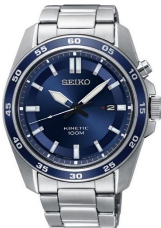
SKA783P1 UVP: 279 Euro