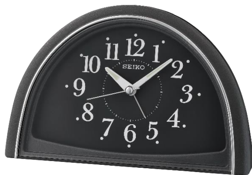
QHE166K UVP 39 Euro