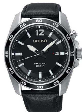
SKA789P1 UVP: 259 Euro