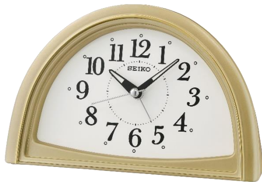
QHE166G UVP 39 Euro