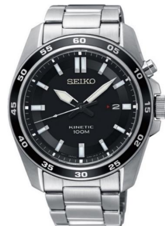
SKA785P1 UVP: 279 Euro