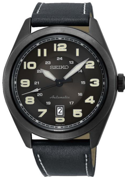
SRPC89K1 UVP: 299 Euro