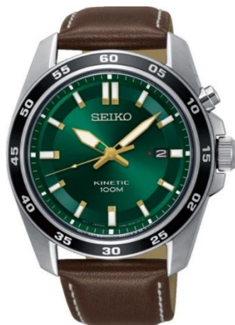
SKA791P1 UVP: 259 Euro