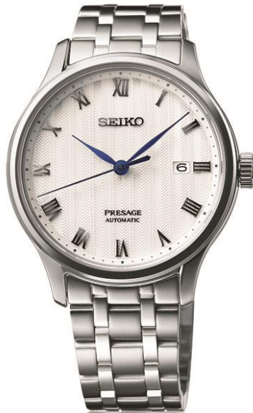
SRPC79J1 UVP: 499 Euro