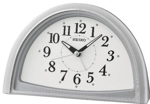
QHE166S UVP 39 Euro